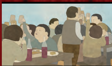
秋 アントニオ・ヴィヴァルディ「四季」より(日本)

映画祭でのグランプリ受賞作品をはじめ、歴代受賞作品から傑作セレクションを上映。フェスティバルディレクター土居伸彰によるトークを交えながら開催しますので、初めて短編アニメーションをご覧になる方もまずはここから最新作品をお楽しみください。(全7作品上映予定)