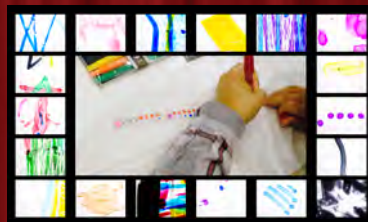
ダンシングラインアニメーション(日本)