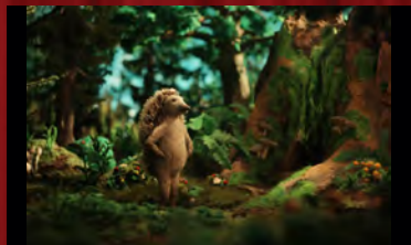
ハリネズミの家(カナダ、クロアチア)

映画祭での受賞作品を中心に、小学生からのお子さまでも楽しめる世界の新しいアニメーションをお届けします。今年1月に交流プラザで開催した、アニメ制作ワークショップの完成作品もトーク付きで上映。ご飲食持ち込み自由ですので、ワイワイお過ごしください!(全9作品上映予定)